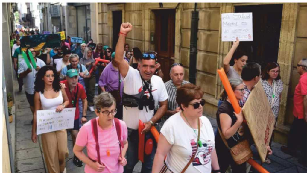
Marcha en Plasencia, por el Día Mundial de la Salud Mental.