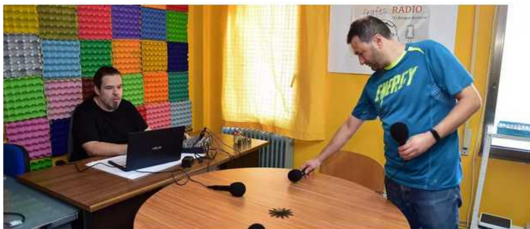
Preparativos para la radio de Feafes Plasencia, con personas con enfermedad mental.