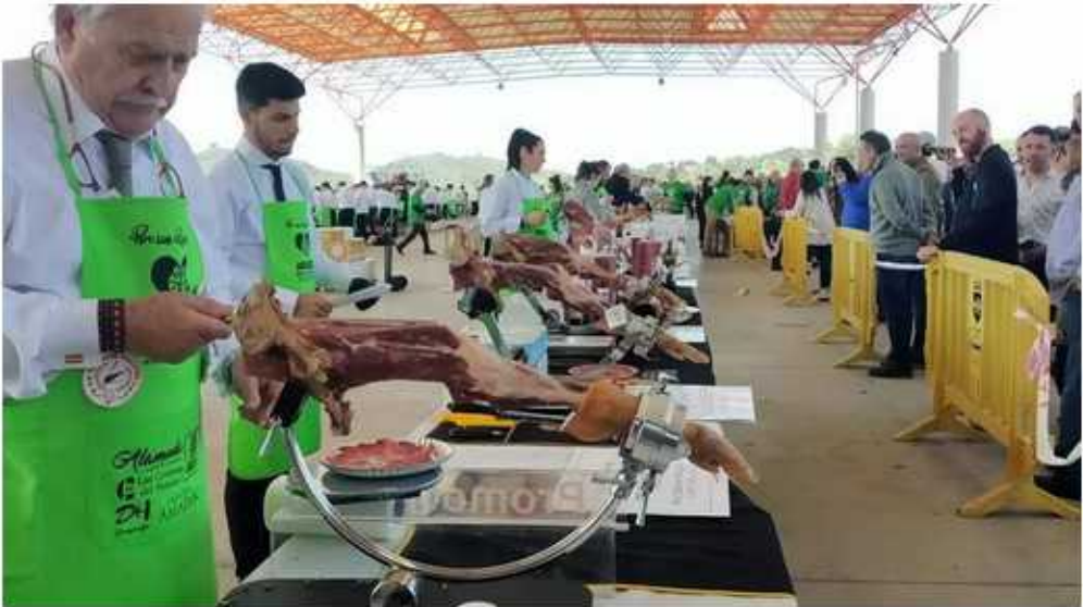
Cortadores de jamón, este domingo en Plasencia por Feafes.

Se elaborarán platos por 3 euros y el dinero se destinará íntegramente a la asociación